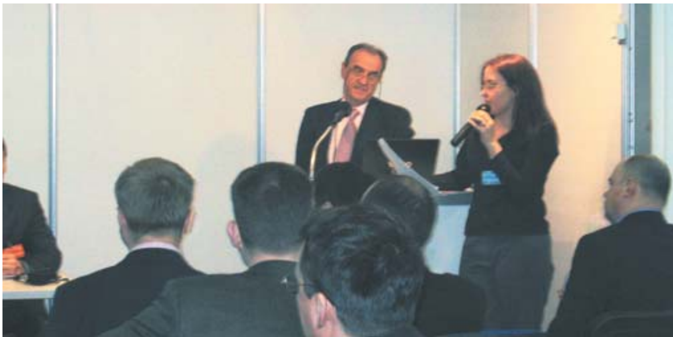
El Gerente de AFEC en el desarrollo de la ponencia en CLIMATE WORLD.

En la realidad, al ser básicamente un mercado de importación, afectan también aunque de forma indirecta, al mercado ruso al conformar las características principales de los equipos que en la actualidad y en el futuro importen de los fabricantes comunitarios, y así fue reconocido en las conversaciones que posteriormente a la conferencia se mantuvieron con algunos representantes de la asociación rusa.