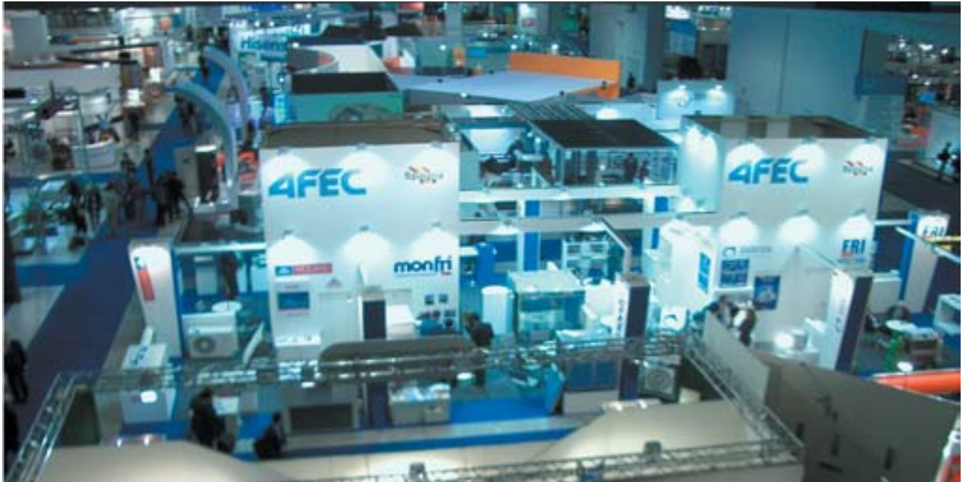
Vista cenital del stand de AFEC en MOSTRA CONVEGNO.

No obstante tanto durante la celebración del certamen como a la finalización del mismo, las empresas mostraron su satisfacción con la cantidad y calidad de los visitantes y en general con su participación en la feria.